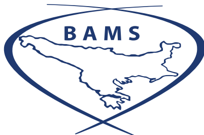
Balkan Association of Nurses

Balkanska asocijacija medicinskih sestara je organizacija udruženja Balkanskih zemalja iz Republike Srbije Udruženje zdravstvenih radnika i saradnika „ESKULAP”, Bosne i Hercegovine Udruženje medicinskih sestara tehničara i babica Republike Srpske i Udruženje anestetičara medicinskih sestara/tehničara intenzivne terapije, reanimacije, urgentne medicine i transfuzije u BiH PULS, Udruženje zdravstvenih radnika Loznice iz Republike Srbije, i Udruženje medicinskih sestara, tehničara, primalja i stomatoloških sestara „ZA NAS” Severna Makedonija (ZMSTAS - ZA NAS), sa tendencijom na proširenje svog članstva sa udruženjima Balkanskog regiona.